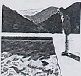
HANS PLESCHINSKI Bildnis eines Unsichtbaren ROMAN, HANSER

Lesung: Hans Pleschinski „Bildnis des Unsichtbaren“ (Hanser Verlag)